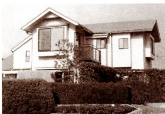
▲住環境の改善を図るため、築15年の戸建て住宅の屋根、外壁にガイナを塗布。